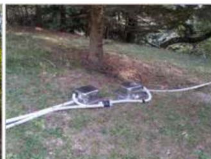
Estensimetri a filo