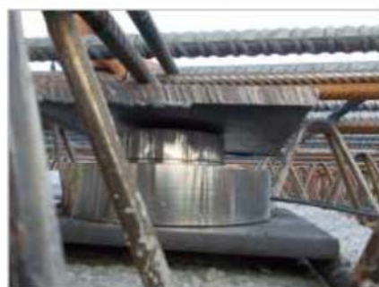
Celle di carico