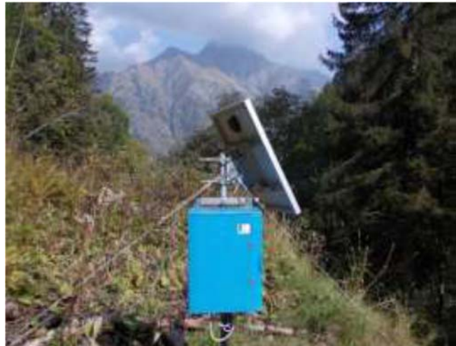
Unità di acquisizione dati

Il cliente può accedere mediante username e password alle proprie pagine dedicate attraverso il sito www.iecitalia.it .